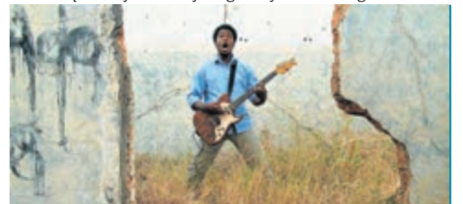
Dodatek przygotowany na zlecenie Górnos Śląskiego Związku Metropolitalnego. Materiały prasowe i zdjęcia pochodzą z GZM, chyba że zaznaczono inaczej

Ruszyła przedsprzedaż karnetów na Ars Independent Festival 2014, który odbędzie się w dniach 23-28 września w Katowicach. Karnety nabyć można w promocyjnych cenach 30 zł (ulgowy) i 40 zł (normalny) w sieci TicketPortal do 24 sierpnia. Ars Independent to festiwal ruchomych obrazów i współczesnej kultury audiowizualnej. Sercem programu są dwa konkursy filmowe: Czarny Koń oraz Czarny Koń Animacji, w ramach których premierowo prezentowane są debiuty oraz filmy drugie reżyserów z całego świata.