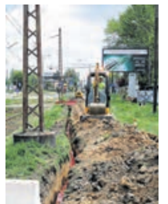
► Prace idą pełną parą. Potrwają jeszcze do końca grudnia 2014 r.

Jesteśmy dzisiaj w pierwszej trójce najlepszych lokalizacji dla usług biznesowych