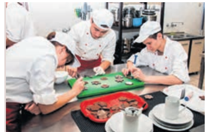
► Uczniowie Zespołu Szkół Gastronomiczno-Hotelarskich zobowiązali się do upieczenia pierników. Podeszli do tego – jak widać – z dużym pietyzmem

Jak co roku, harcerze przywieżą także do Bytomia Betlejemskie Światło Pokoju i przekażą je prezydentowi miasta. A on z kolei przekaże je mieszkańcom. ●