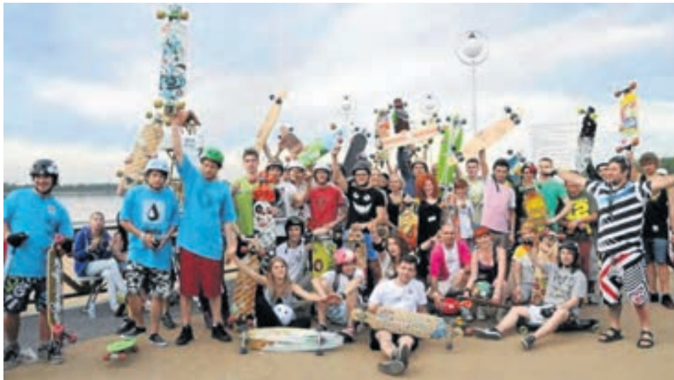
► Uczestnicy ubiegłorocznego festiwalu Dębowy Maj, jak widać, na brak atrakcji nie narzekali. Buzie roześmiane, pełny luz, relaks i wypoczynek. Ale... aktywny. Bo impreza ma charakter sportowy, co nie przeszkadza w rozrywce

Ideą festiwalu jest pokazanie szerokiego wachlarza możliwości, które dają nam obiekty Pogoria III oraz ich otoczenie przyrodnicze. Jest nią również, a może przede wszystkim, także promocja dą-