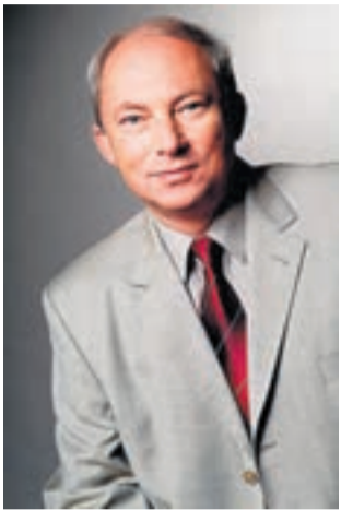
Kazimierz Górski, prezydent Sosnowca

Wychodząc naprzeciw oczekiwaniom naszych mieszkańców, skutecznie dopominaliśmy się i walczyliśmy o inwestycje tramwajowe w naszym mieście. W porozumieniu z Tramwajami Śląskimi udało się nam przeformować sporo planów i projektów, które już niedługo zostaną wprowadzone w życie i poprawią komfort przejazdów.