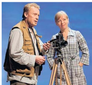
TEKST: ROBERT LIWORSKI/WARCH POLONIA