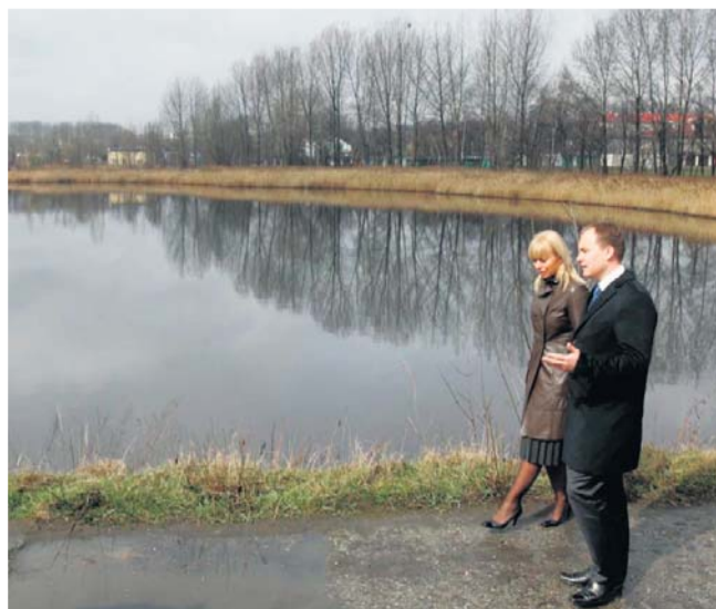
Minister rozwoju regionalnego Elżbieta Bieńkowska i prezydent Dawid Kostempski nad stawem Kalina rozmawiają o planie jego rewitalizacji

szu Ochrony Środowiska i Gospodarki Wodnej w Katowicach – wyjaśnia Dawid Kostempski, prezydent Świętochłowic.