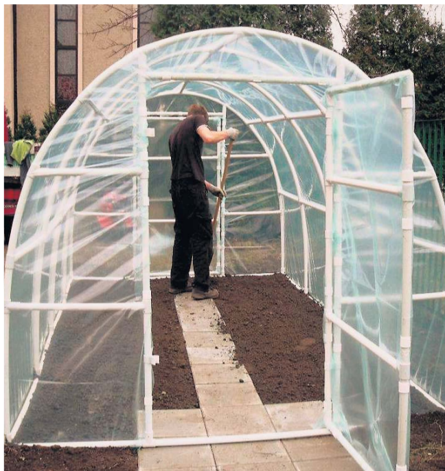
Do 30 kwietnia trwają prace przy zakładaniu ogródków. Przedszkola miały możliwość wyboru projektu – szklarnia, folia lub ogródek otwarty

– Jako matka 4-latkę nie umiem zdrowo gotować, od kogo więc moje dziecko miałoby się tego nauczyć? Pomyślałam, że byłoby super gdyby mój syn zdobył tę wiedzę